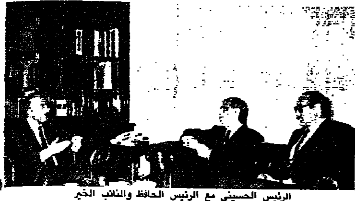
الرئيس الحسيني مع الرئيس المحافظ والنائب الخرج